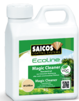
SAICOS MAGIC CLEANER