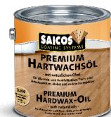
SAICOS PREMIUM HARDWAX-OIL

Pastaba Kyla savaiminio užsidegimo pavojus, todėl šluostės, kempinės ir kt. naudotos valymui priemonės po alyvavimo turi būti sudegintos arba išmirkytos vandenyje.