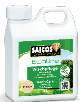
SAICOS WASH CARE

Jei grindys yra giliai pažeistos arba prasitrusios, švelniai nušlifukite tas vietas. Išsiurbkite visą paviršių, kad neliktų dulkių ir laikydamiesi alyvos gamintojo instrukcijų padenkite papildomu alyvos SAICOS PREMIUM HARDWAX-OIL sluoksniu.